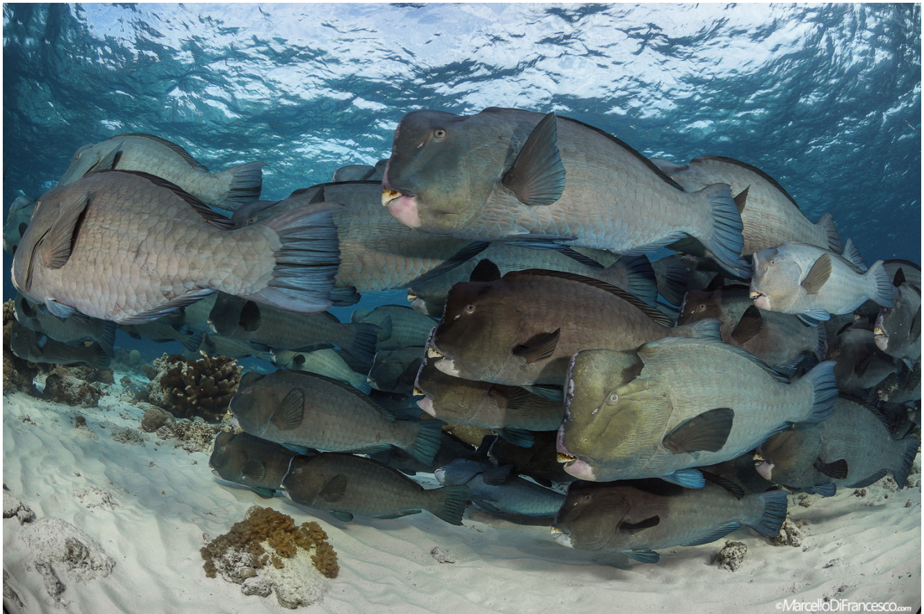
Ławica papugoryb o świcie w płytkiej części rafy przy Barracuda Point. (Canon 5Dmk3 + Tokina 10-17mm Nauticam Housing - F10 1/80 iso 160)

Po przybyciu na miejsce przewodnicy nurkowi sprawdzają prąd i - w zależności od jego siły i kierunku - wybierają, z której strony rafy zaczną się nurkowanie. Nurkowanie odbywa się wzdłuż pionowej ściany, z niezwykle bujnym życiem: wielkimi wachlarzami gorgonii, gąbkami i czarnymi koralami przemieszany z miękkimi koralami we wszystkich kształtach i kolorach, dodającymi uroku krajobrazom o wyjątkowej urodzie, które aż kipią życiem.