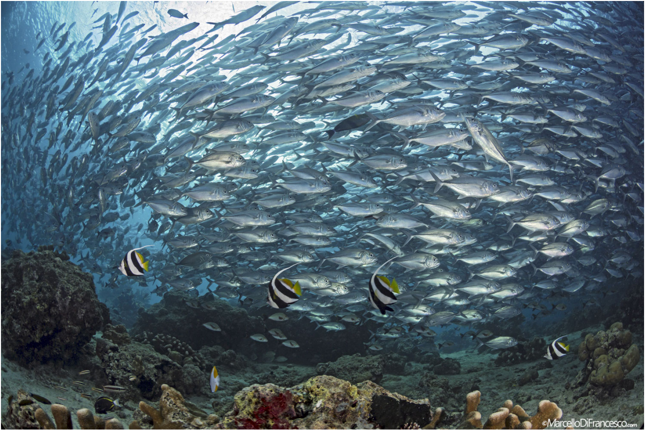
Karanks i życie na rafie. (Canon 5Dmk3 + Tokina 10-17mm Nauticam Housing - F9 1/200 iso 200)

Kontynuując nurkowanie docieramy do wyłazczenia, które tworzy małe "siodło" na głębokości około 22 metrów. To właśnie tam, z dala od błękitnej głębi, gromadzą się barakudy. Jeśli prąd wody nie jest zbyt silny możesz opuścić ścianę i popłynąć do nich, aby obserwować je z mniejszego dystansu.