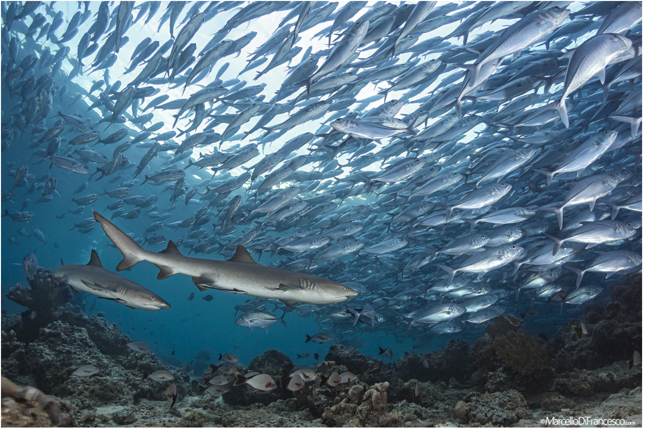
Żarłaczki białopłetwe polujące na rafie. (Canon 5Dmk3 + Tokina 10-17mm Nauticam Housing - F8 1/100 iso 250)