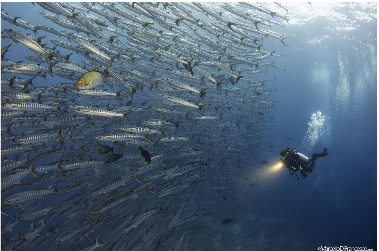
Ściana barakud, magia w wodach Malezji. (Canon 5Dmk3 + Tokina 10-17mm Nauticam Housing -