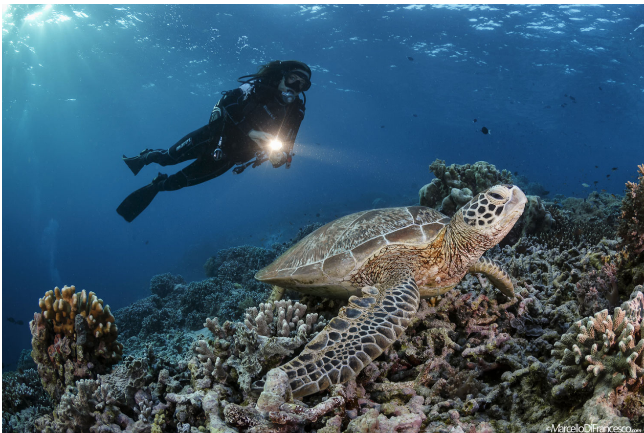
Zielony żółw w porze jedzenia, jedno z wielu spotkań w tym niesamowitym morzu. (Canon 5Dmk3 + Tokina 10-17mm Nauticam Housing - F9 1/60 iso 200)

Na pewno Barracuda point jest jednym z najcenniejszych miejsc nurkowych w całym obszarze morza Celebes. Jej położenie geograficzne i unikalna struktura pozwala na koncentrację wielkich ławic drapieżników pelagicznych w tych wodach: ryby w okóło, z nieprzeniknionymi ścianami barakud i karankami pływającymi dookoła i nad nurkami, niezliczone gatunki mniejszych ryb, nadających koloryt rafie, czy żółwi, które nie niepokojone pływają w wodzie.