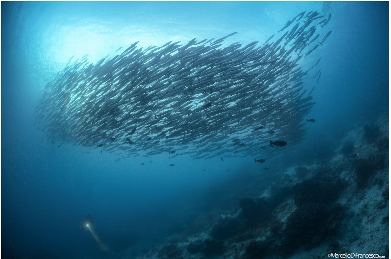
Ławica barakud. (Canon 5Dmk3 + Tokina 10-17mm Nauticam Housing - F10 1/30 iso 200)

Liczne ławice ryb nie są jedyną atrakcją tego miejsca nurkowego. Wystarczy spojrzeć prosto w głąbię i często można zobaczyć białą krawędź płetwy rekina materializującego się przed tobą, który patroluje okolice rafy w poszukiwaniu czegoś do jedzenia, duże tuńczyki czy samotne barakudy sprawdzające linię rafy. Często można spotkać żółwie, napoleony czy orlenie.